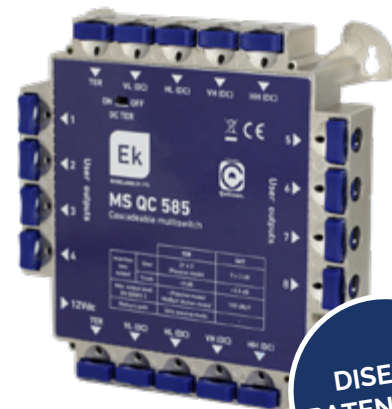
MS QC 585